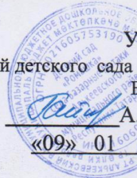
График родительского контроля на 2024 год